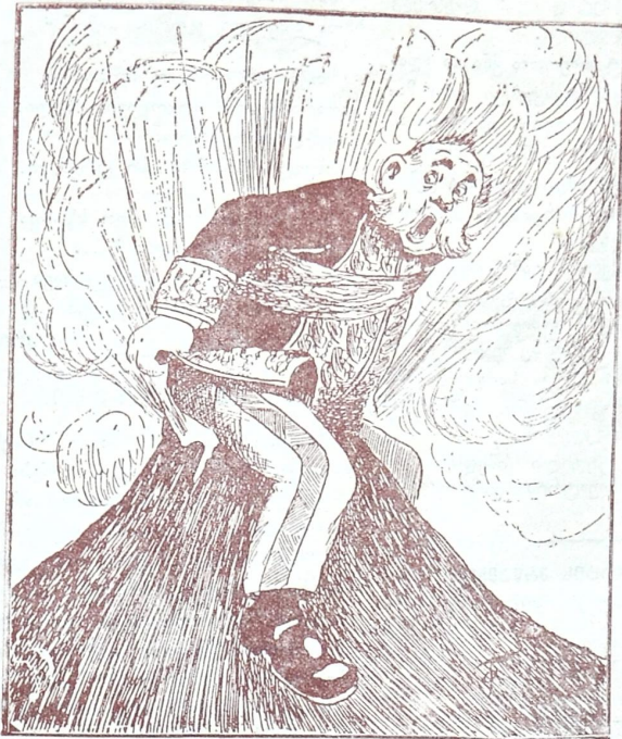
ვ უ ლ კ ა ნ ი.