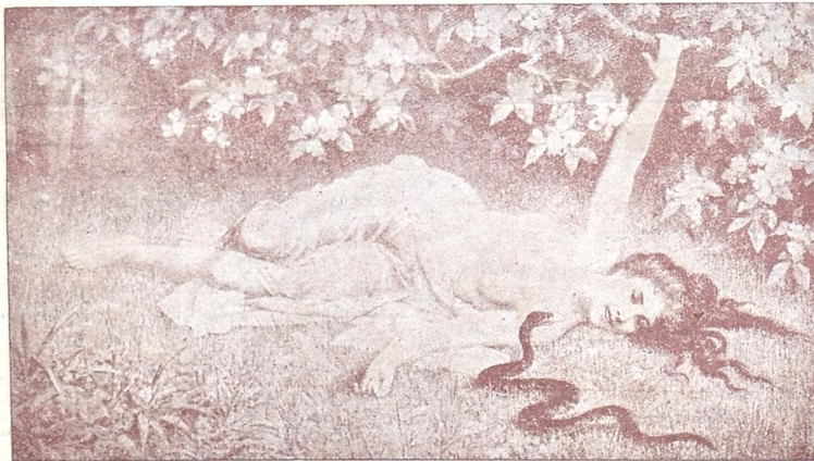
ვ ვ ა.

სულ მოკლე ხანში სადგურ აქსტაფაში განთავისუფლდება ადგილი შკაფიდგან წიგნების გამყიდველი ქალისა. ჯამაგირათ 15 მანეთი და 15 3 / 4 ქ. ექნება. ამას გარ- და საჯარო ვაჭრობით გაიყიდება—დარ- ჩენილი ჟურნალ-გაზეთები კაბის, პუდრის, უმარულის და სხვა ქალთა სამკაულის გამოსახვევით და ერთიკ თმის დასახუ- ტუქტებელი „მაშინკა.“ ქალი თუგინდ ყვითელი, გინდ სულ უშნო იყოს, სულ ერთი. ოღონდ ცოტა „ნეწათ“ ლაპა-